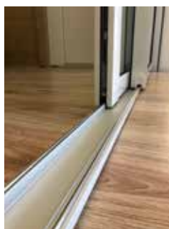
2 carriles, hasta 4 hojas

Nuestro compromiso por la sostenibilidad queda avalado por: