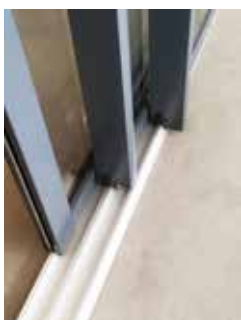
3 carriles, hasta seis hojas

Opción con solera rebajada de 20 mm apta para personas con movilidad reducida. Sistema con dos o tres carriles